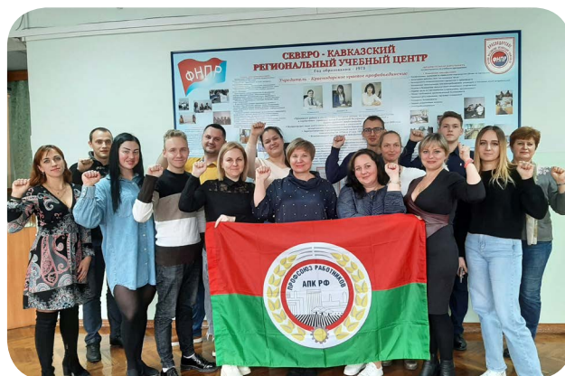
Краснодарская краевая организация

Краснодарская краевая организация Профсоюза провела семинар для членов молодежного совета краевой организации, профсоюзных активистов территориальных и первичных профорганизаций на тему: «Переговоры в работе профсоюзной организации».