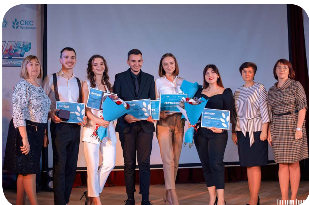
Воронежская областная организация

Состоялся конкурс областного объединения организаций профсоюзов «Студенческий лидер Воронежской области — 2021». Чтобы отстоять свое право носить это звание, участникам было необходимо пройти через ряд непростых испытаний. Конкурсная программа была разделена на два этапа. Задания «Правовое ориентирование», «Профтест», «Блиц» были направлены на проверку знаний в области законодательства и профсоюзной деятельности. Испытания «Автопортрет», «2 к 1», «Сюрприз» выявляли эрудированность конкурсантов, их умение проявлять лидерские качества, творческий потенциал, демонстрировали успехи студентов в общественной деятельности.